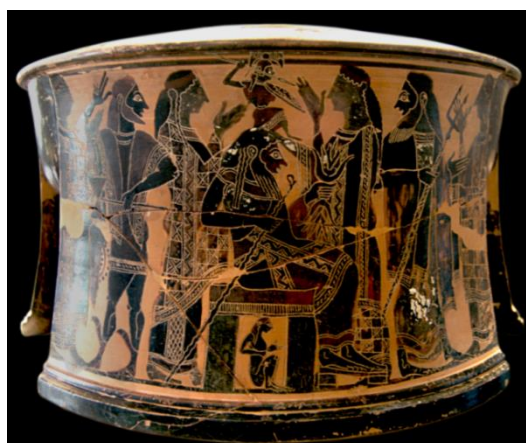
La déesse Metis est figurée accroupie sous le trône de Zeus

Le nom de Metis est celui de la déesse grecque de la ruse, moins bien connue. Fille d'Oceanos et de Thetis, mère d'Athena (conçue avec Zeus). Elle est figurée sur les objets d'art de l'époque assise sous le trône de Zeus. La mythologie dit qu'elle est la conseillère très écoutée par Zeus.