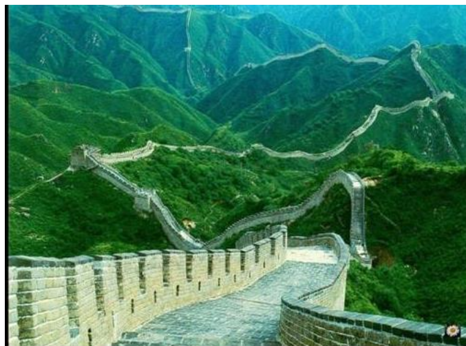
Le Grand Mur de Chine a pu être traversé par les mongols utilisant la tromperie

Le mensonge et les simulacres sont des outils quelques fois, très efficaces. La revue National Geographic (numéro de juin 2017) montre une statistique fort instructive d'utilisation du mensonge : Plus de la moitié des mensonges sont utilisés pour se protéger ou pour tirer divers avantages personnels.